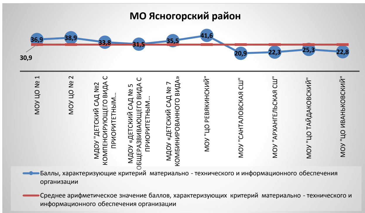
Рис.49. Оценка материально-технического и информационного обеспечения образовательных организаций МО Ясногорский район

При среднем значении 30,9 баллов, также выше среднего значения результаты у следующих образовательных организаций Ясногорского района: