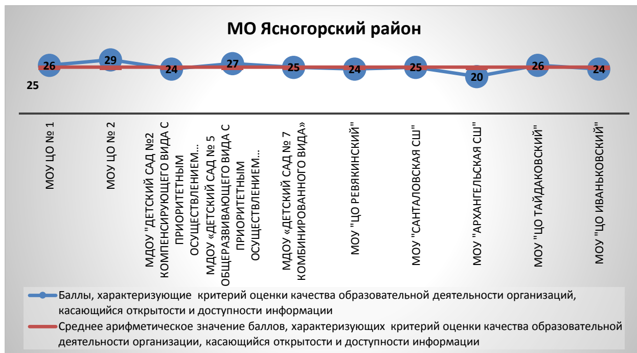
Рис.24. Оценка качества образовательной деятельности организаций МО Ясногорский район, касающаяся открытости и доступности информации

В ОО Ясногорского района наиболее высокие баллы по данному блоку получили МОУ ЦО № 2 (29 баллов). Наименьшее количество баллов в МОУ «Архангельская СШ» (20 баллов). Рис.24.